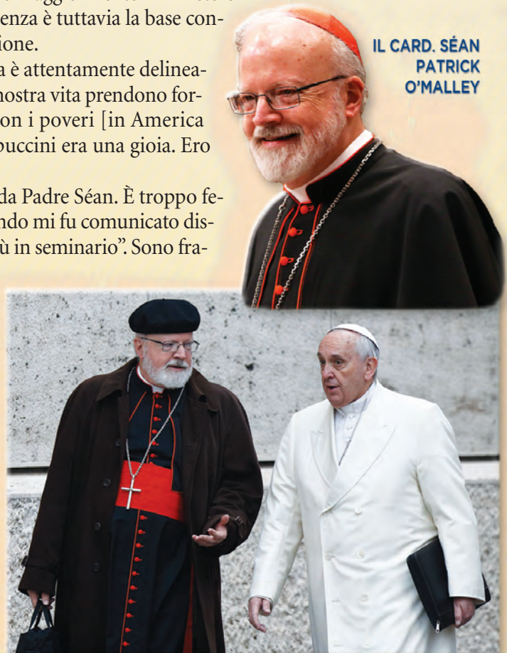
IL CARD. SÉAN PATRICK O'MALLEY